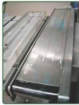
自动清洁胶头装置