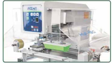
两旁安全感应滑动机翼