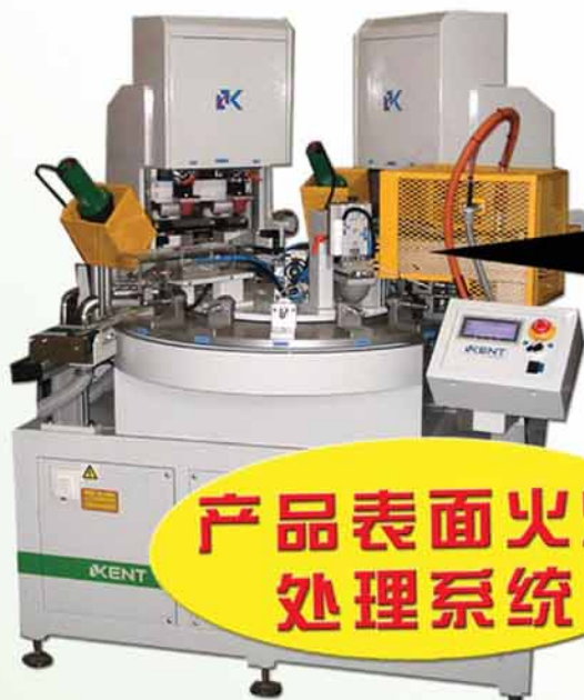
产品表面火焰 处理系统