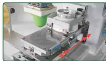
油杯平台前后推送运作 (自动清洁胶头收藏底部设计)