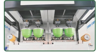
4个独立胶头上/落气筒