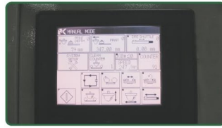
PLC轻触式大触摸屏操控