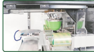
程式控制自动清洁胶头